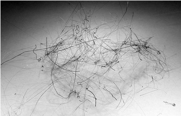
Fig. 1 : Pele's Hair, Hawaï.

Une étrange structure filiforme provenant du pied du volcan Kilauea, à Hawaï, est passée entre de nombreuses mains avant de se retrouver ici, devant vous.