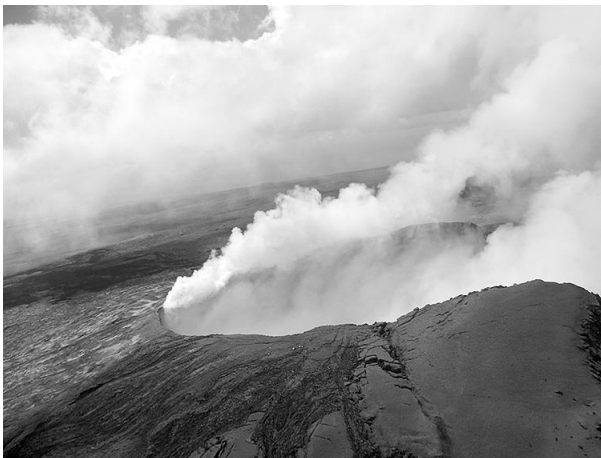
Fig. 2 : Cratère fumant du volcan

Pendant trois jours, nous avons plongé dans un monde incroyablement impressionnant, dominé par le caprice des forces de la nature. Le paysage changeait d'aspect selon que nous traversions des déserts de lave noire d'âges différents ou des zones de forêt tropicale. Nous avons pu observer ce décor encore mieux depuis les airs. L'approche du cratère fumant du Kilauea (fig. 2), qui projette sans discontinuer des matériaux depuis 1983 et ensevelit ainsi chaque jour des terres fertiles, a fait naître des images de la surface lunaire