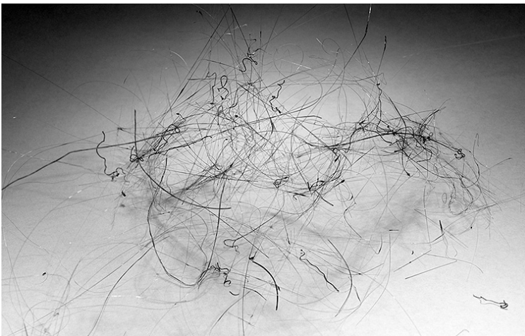
Abb.1: Pele's Hair, Hawaii.

Ein seltsames Fadengebilde vom Fuß des Vulkans Kilauea auf Hawaii ist durch viele Hände gegangen, bevor es hier vor Ihnen liegt.