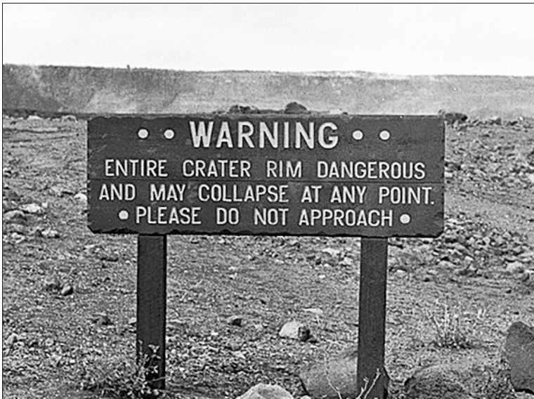
Hinweisschild am Rande des Mount Kilauea

Jetzt wird es gefährlich: Pr 29.2 nähert sich: Ich gehelspringe recht rasch einen Waldweg entlang, wie ein Kind, das hüpfte; dort vorne ist eine Linie, die muss ich überspringen; jenseits dieser Linie ist der freie Fall. Genau das erlebt Pr 8, die eine „Klippe“ runterfällt, im Fallen erwacht, zitterig, verschwitzt, verängstigt, mit klopfendem Herzen. Breit sei die Klippe gewesen, weit und leer; es war nicht dunkel, aber zu sehen war (wegen Nebels?) nichts.