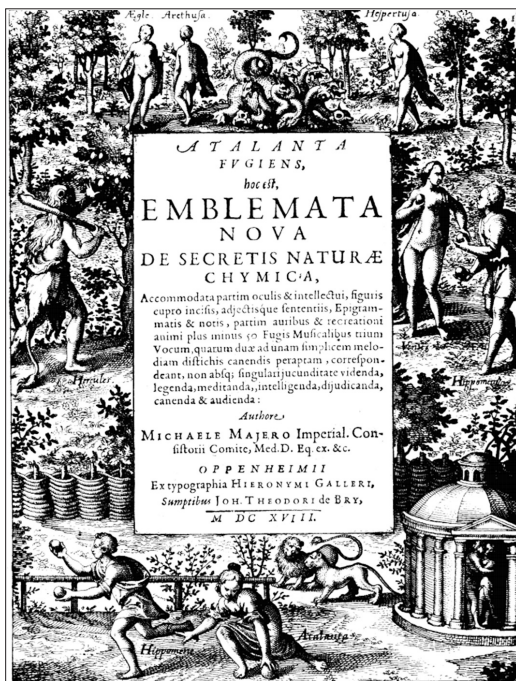
Michael Maiers Atalanta Fugiens, 1618

Two = the opposites & particularly masculine and feminine, Logos and Eros.