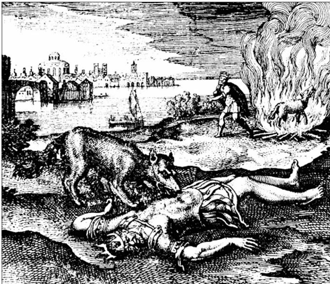
“A wolf devoured the king, and being burnt it restored him to life again” aus: Atalanta fugiens von Michael Maier, 1618