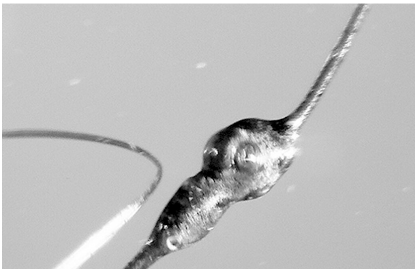
Abb. 3: Pele's Hair mikroskopisch.

Haben wir es nun bloß mit einer Variation von Basaltgestein zu tun oder eher mit einem Edelstein? Diese Frage werden wir später aufgreifen, um nach Auswertung aller Daten von Pele's Hair eine Antwort auf homöopathischer Ebene zu geben.