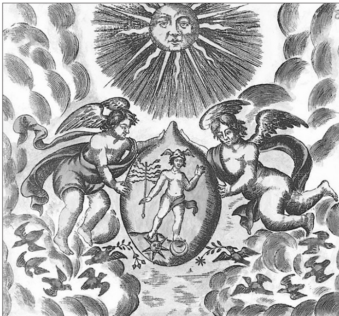
Der Adept in der Blase, aus Bibliotheca chemica curiosa, Genf 1702

spherical being, the most serene God, springs from the union of opposites. It sheds a special light on the perfect round nature of the lapis. The dream of prover 44 reflects this numinous quality in her dream of the bubble. As it rises up from her body, she feels soothed by it. In the dream of prover number 22f it simply makes an appearance.